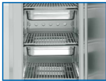
5 contenedores GN 1/1 en modo abatimiento