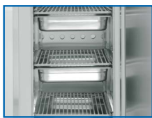
5 contenedores GN 1/1 en modo abatimiento