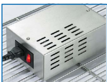
Esterilizador/iodinador para desinfección total y eliminación de olores (OPCIONAL)