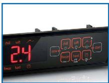
Controlador electrónico programable