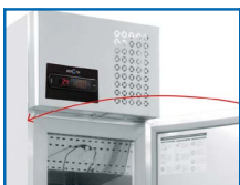
Puerta de apertura automática y bloqueo a 100°