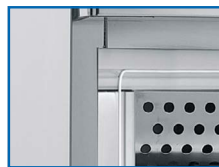
Materiales de calidad y resistencia