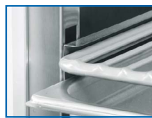
Estantes en E para rejillas y recipientes GN 1/1