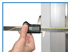
Aislamiento ecológico con 80 mm de espesor