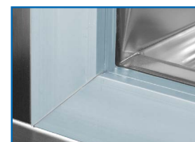
Marco calefactado. Evita condensación y hielo