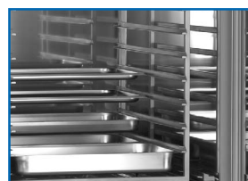
Soporte y Bandejas fácilmente desmontables