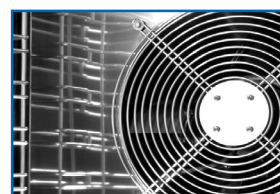
Reparto uniforme del aire