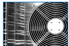
Reparto uniforme del aire