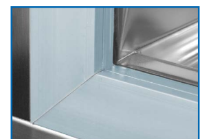
Marco calefactado. Evita condensación y hielo