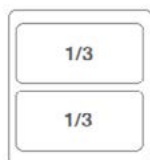
OPCIÓN 1 (CONSULTAR)