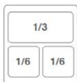
OPCIÓN DE SERIE