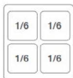
OPCIÓN 2 (CONSULTAR)