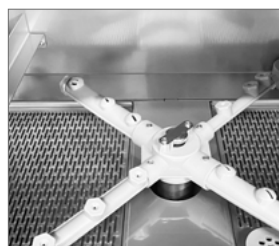
Brazos desmontables en PVC alimentario y fibra de vidrio (30%)