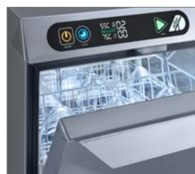
Display digital visual e intuitivo.